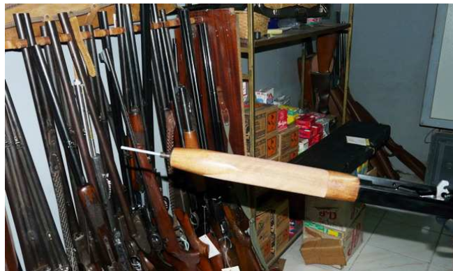
Detalle de una repetidora que quedará prohibida si se aplica el Artº 5 del borrador del nuevo Reglamento de Armas, tal cual está redactado hoy.

La Unión, por las consideraciones que está recibiendo, dejará de forma clara en las alegaciones que presente el rechazo y la oposición de los cazadores a ciertas cuestiones que les perjudican notablemente, además sin que éstas tengan una valoración de peso tanto técnica, jurídica, social o de seguridad ciudadana, como se desprende en buena parte de las modificaciones que el Ministerio del Interior pretende introducir en el Reglamento de Armas.