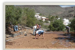
Recuperación de terreno

La UNAC pretende que se conozca y se reconozca la gran labor que han venido y vienen realizando las asociaciones de cazadores sin ánimo de lucro en la custodia del patrimonio natural cinegético, quiere establecer un lugar de encuentro y conocimiento en ese gran trabajo que realizan las sociedades de caza en la preservación de esa parte de nuestro patrimonio silvestre natural que son las especies cinegéticas, y acomete la tarea de establecer las directrices para la consecución de dichos objetivos. Para todo ello abre este espacio en su Web, para dar a conocer la custodia de la caza y su mundo, con el fin de que los cazadores conozcan y, exijan sus derechos y reconocimientos, en base a realidades y legitimidades.