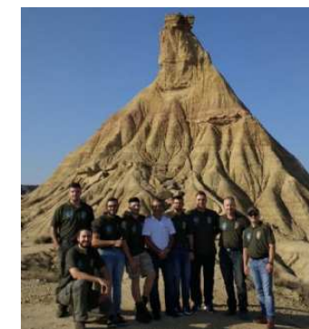
Camisa verde cazadores de la Comunidad Valenciana, con camisa blanca Presidente de la UNAC

El II encuentro nacional de jóvenes cazadores ha tenido lugar los días 22, 23, y 24 de septiembre de 2017. A él asistió una representación de valencianos a través de la Asociación de Entidades de Caza de la Comunidad Valenciana (ADECACOVA), miembro fundador de la Unión Nacional de Asociaciones de Caza (UNAC), cazadores de la Asociación Local de Cazadores La Codorniz de Aiello de Rugat, de la Real Asociación de Caza y Tiro Montduver de Gandía, de la Sociedad Local de Caza de Villalonga, y de la Sociedad de Cazadores 'EL CASTELLET' de Salem.